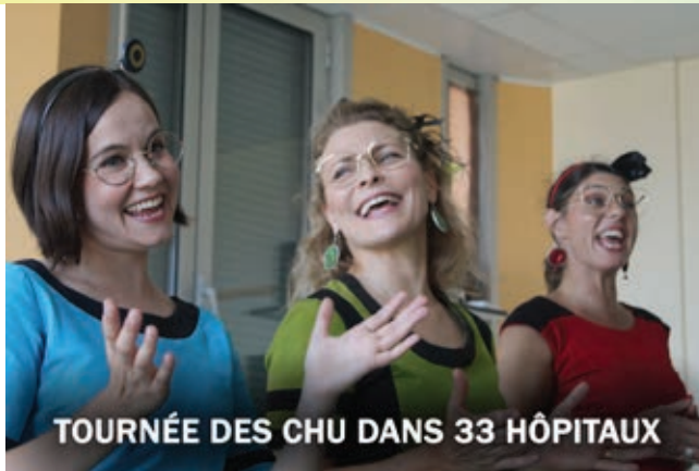
TOURNÉE DES CHU DANS 33 HÔPITAUX