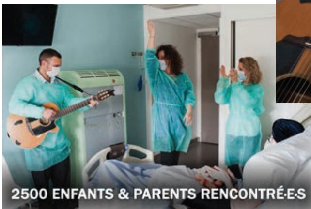
2500 ENFANTS & PARENTS RENCONTRÉS