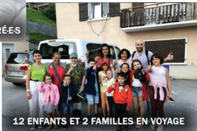
12 ENFANTS ET 2 FAMILLES EN VOYAGE