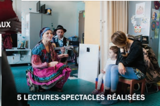
5 LECTURES-SPECTACLES RÉALISÉES