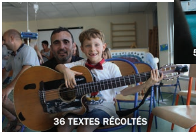
36 TEXTES RÉCOLTÉS