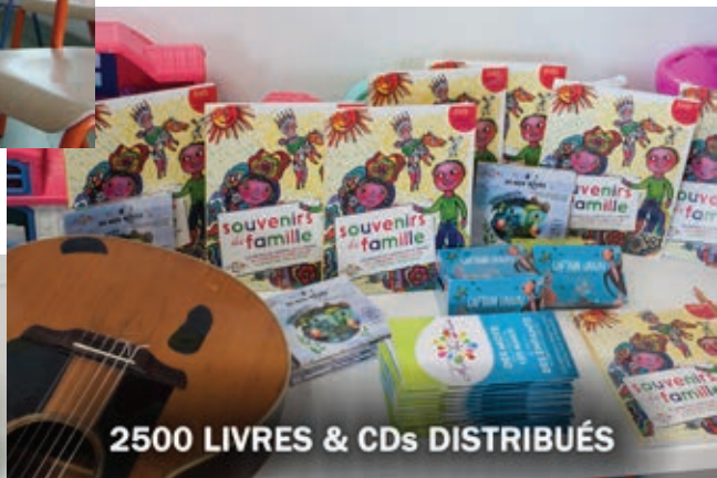
2500 LIVRES & CDs DISTRIBUÉS